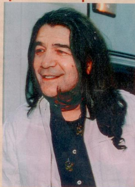
A to je on - Drupi opět po letech v Praze